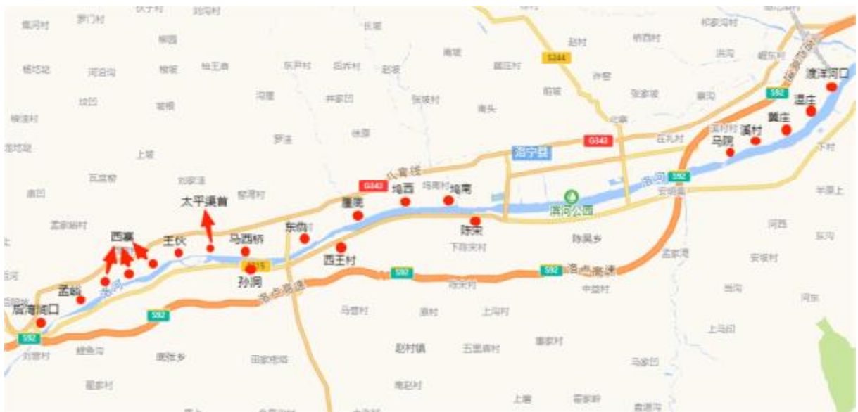
图3.4-1 监控设备分布图

利用影像监控设备和卫星定位系统，对车辆运输、储砂场货物吞等重点地段和部位实时监控，按照要求联网至河长办。监控共设置 20 台，分别位于渡洋河口、温庄、冀庄、溪村、马院段、陈宋-新宇学校门口、西王村大桥、孙洞、坞南、坞西、崖底、东仇、马西桥、太平庄渠首、王伙、西寨 3 台、孟峪河口、后湾涧口。